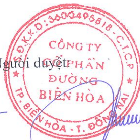
Thái Văn Chuyên Chủ tịch

Các thuyết minh đính kèm là bộ phận hợp thành của báo cáo tài chính hợp nhất này