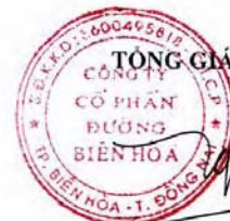
Trần Quốc Trang