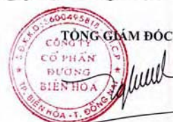
Trần Quế Trang