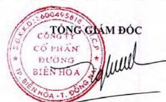
Trần Quế Trang